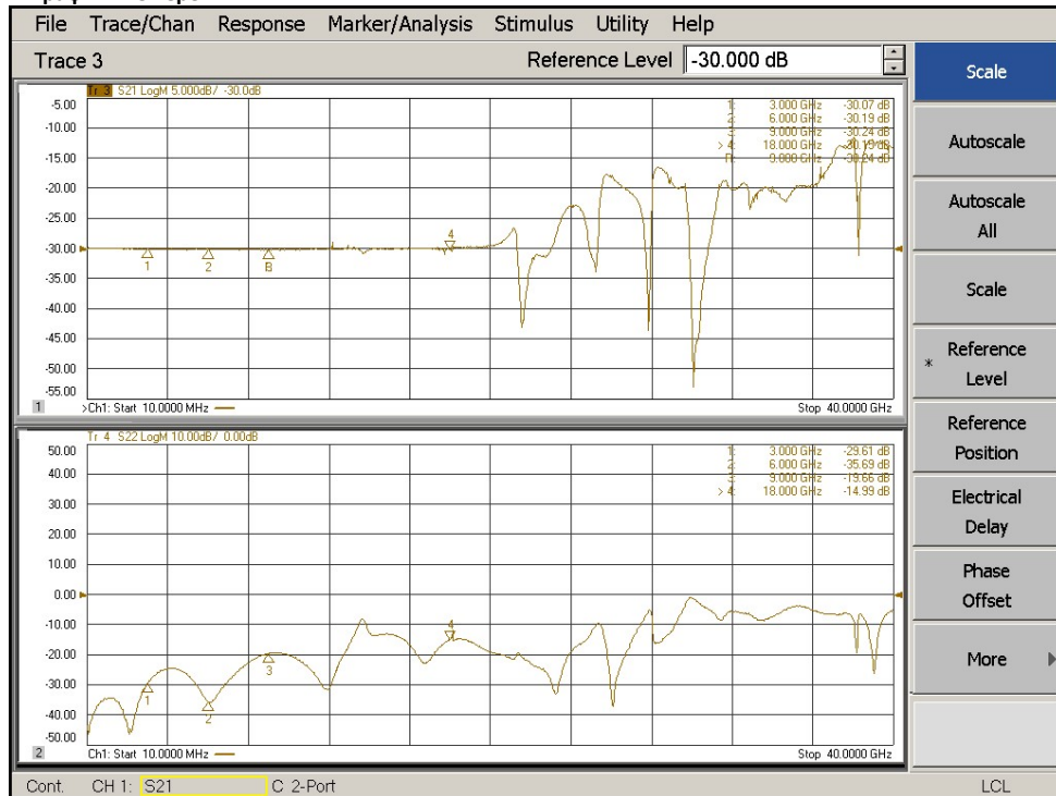
Графики для АЧХ при отсчётном уровне равном -30 дБ и 0 дБ